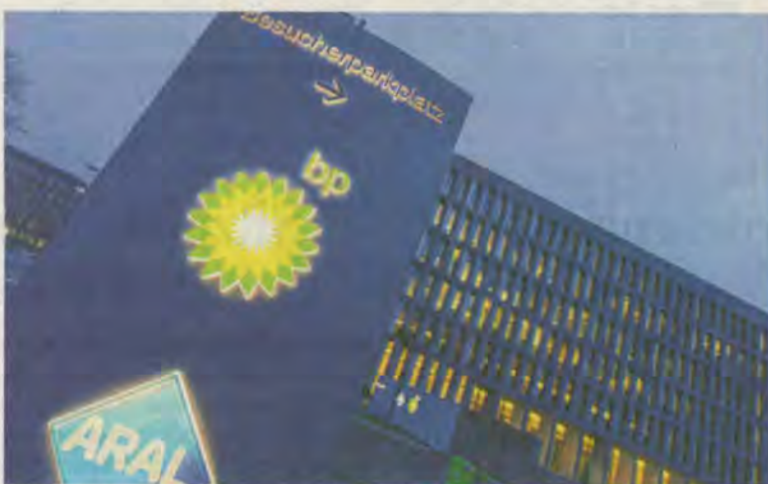
Das Streichprogramm wird auch die Bochumer BP-Zentrale treffen.

Bochum. Der Bochumer Aral-Mutterkonzern BP stellt sich auf eine schrumpfende Nachfrage nach Benzin und Diesel ein und streicht daher Hunderte Arbeitsplätze in Deutschland. Bis Ende 2020 sollen weitere 580 Stellen wegfallen, kündigte Michael Schmidt, der Chef von BP Europa, an. Dabei läuft bereits ein Programm zum Stellenabbau. Vor einigen Monaten war mit den Betriebsräten die Streichung von 250 Arbeitsplätzen in Bochum vereinbart worden, davon sind bis jetzt etwa 100 Stellen verschwunden. Die Pläne von BP sehen auch vor, Arbeitsplätze von Bochum nach Bu-