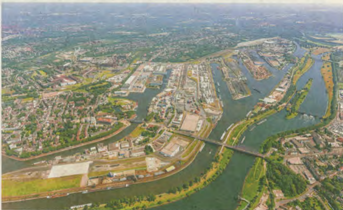
Ein gewichtiger Industriestandort in NRW: der Duisburger Hafen, hier ein Luftbild.